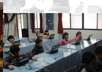
低年級使用電子書包