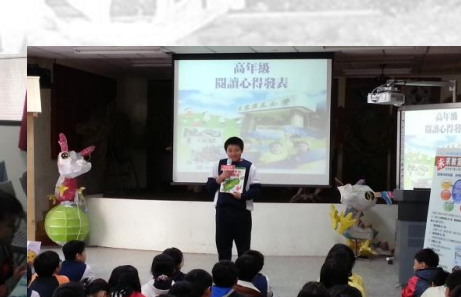
高年級閱讀心得發表